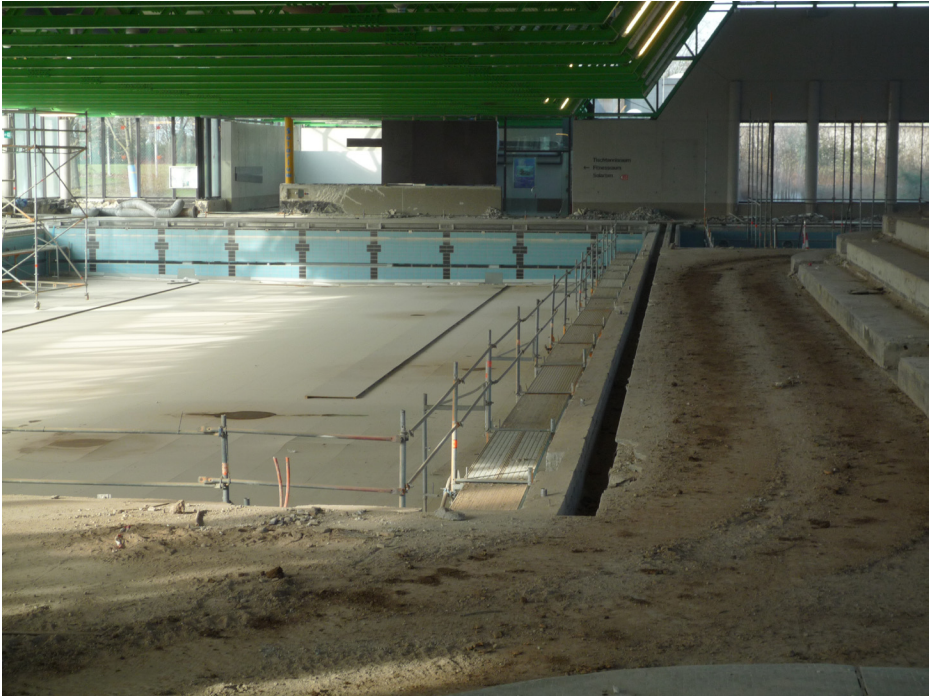
Bauarbeiten im Westbad