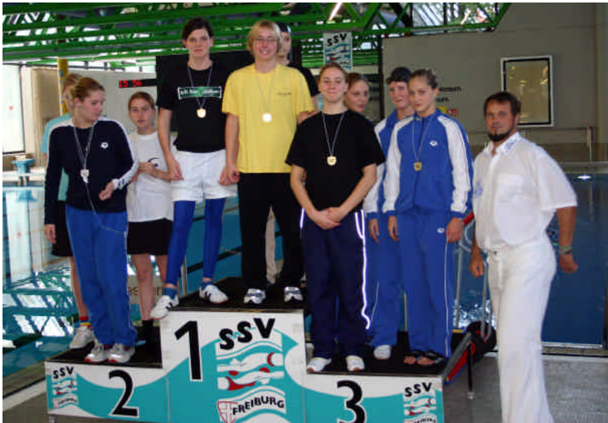
Badische Kurzbahnmeisterschaften (S. 30)